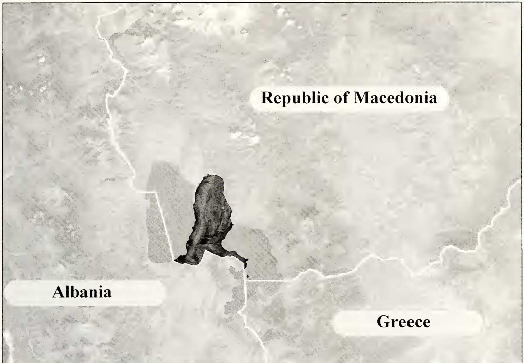
Fig. 1. The location of Galičica in the Republic of Macedonia.